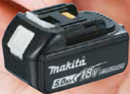
5,0 Ah BL1850