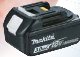
3,0 Ah BL1830