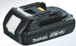
1,5 Ah BL1815N