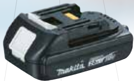
2,0 Ah BL1820