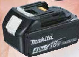
4,0 Ah BL1840